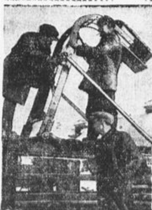
Ремонтируют машины к посевной кампании.