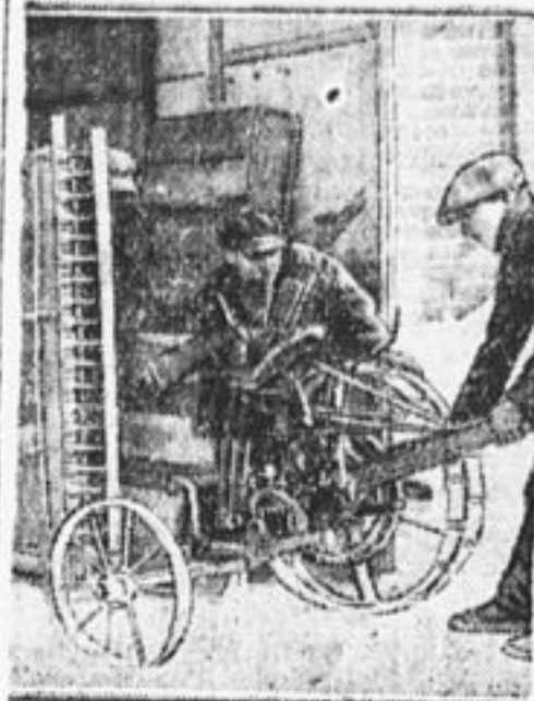
Рабочие ремонтной мастерской сажают машины, сделанные из старых негодных сел.-хоз. орудий.