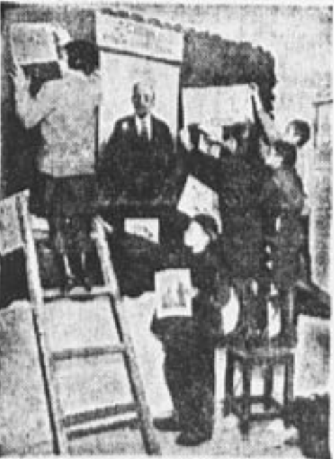
Украшают ленинский уголок.

База спит. В кино ходят редко, экскурсии бывают редко. С другими базами связи нет. С деревенским отрядом — тоже. Переписка с иностранными пионерами как-то завязалась, но после бесславной заглохла. Нет никакой связи с Красной армией. Санитарный кружок, военный кружок — все это ребята с «Крас-