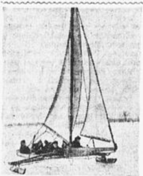
Ленинградские ребята на буэре.